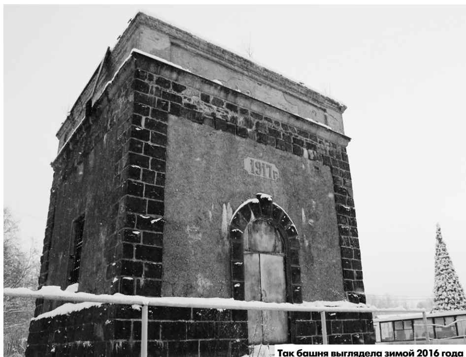
Так башня выглядела зимой 2016 года