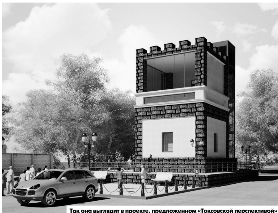
Так она выглядит в проекте, предложенном «Токсовской перспективой»